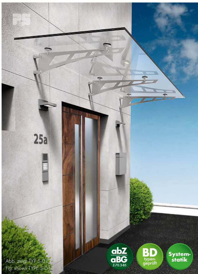
Abb. zeigt TYP S-01 Fig. shows TYPE S-01