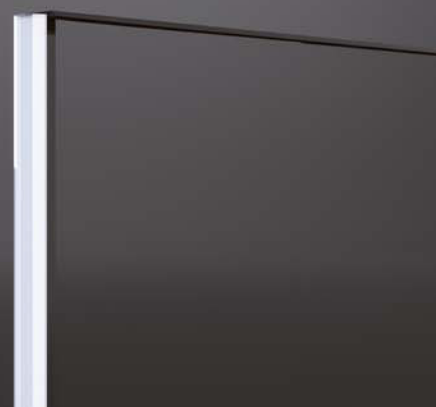
Neues, selbstklebendes Dichtprofil